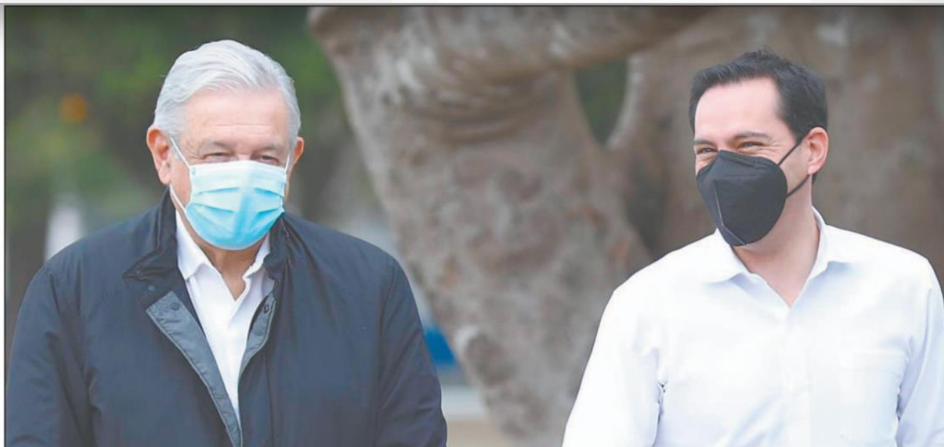
Tras la supervisión de los tramos del ferrocarril que recorrerá Yucatán, el mandatario de la nación viajó a Quintana Roo para hacer lo propio en el vecino Estado. (Víctor Gijón)