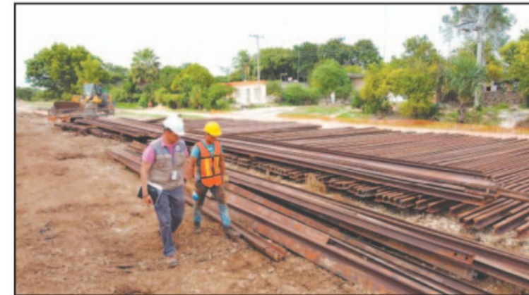
Afirman que el proyecto ya generó más de 90 mil empleos.