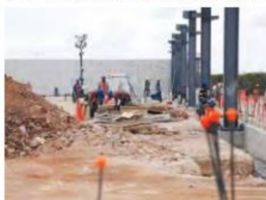
LA recuperación económica continúa avanzando.

calidad de vida son una prioridad para el Estado de Yucatán, con este proyecto que nos beneficia a todos y promueve la economía local, lo que da muestra de que el mejor trabajo es en equipo para brindar la oportunidad de empleo que le vamos a dar a toda la población", externó.