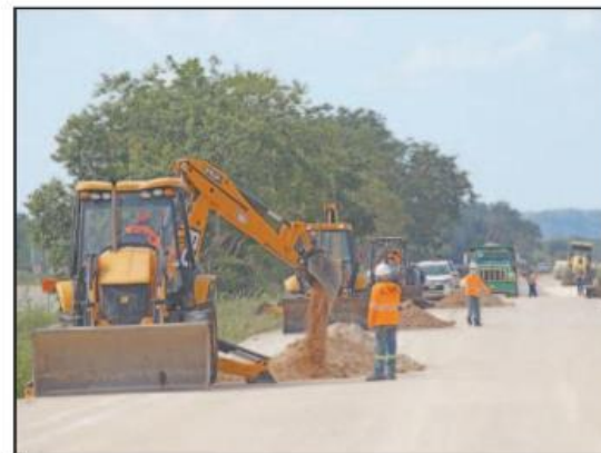
El objetivo es impulsar la reactivación económica.