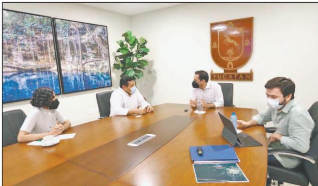
Autoridades buscan generar desarrollo y mejores oportunidades a los ciudadanos. (POR ESTO!)