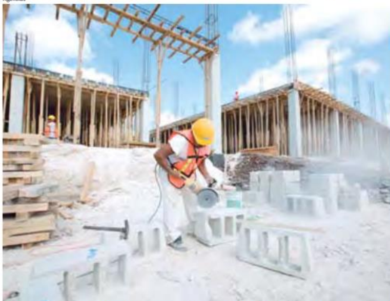
EL sector de la construcción fue una de las actividades que disminuyeron 0.19 por ciento.

● Las actividades terciarias o de servicios sólo aumentaron 0.08%, inferior al avance de 0.63% de noviembre.