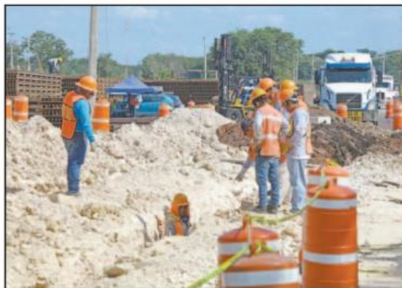
El megaproyecto beneficia con la creación de empleos.